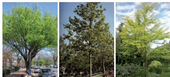
Orme de Chine

EXEMPLES D'ARBRES D'ALIGNEMENT STRUCTURANT LE TRACÉ À EPINAY-SUR-SEINE